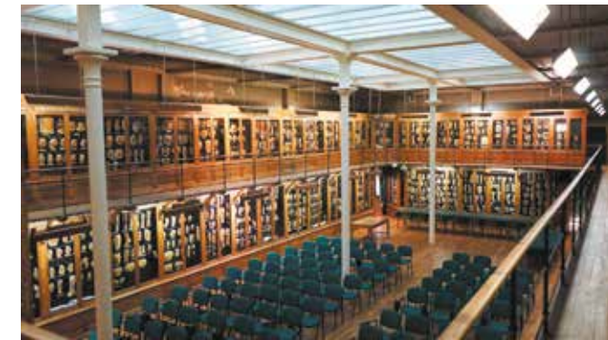
Musée des Moulages / D.R. © AP-HP

Au musée des Moulages de l'Hôpital Saint-Louis