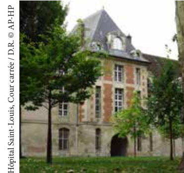
Hôpital Saint-Louis, Cour carrée